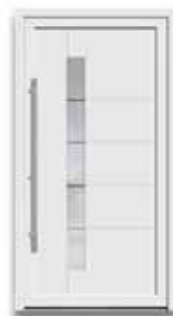
5869 S. 24