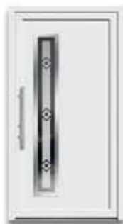
5178 S. 22