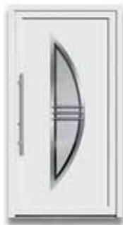
5890 S. 42-43