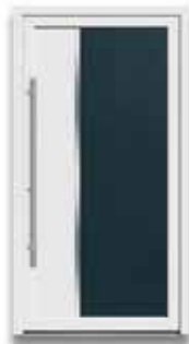
5862 S. 16