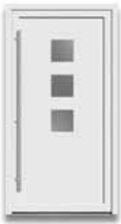
5703 S. 34