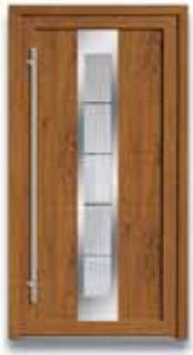
5867 S. 28