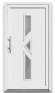
5035 S. 55