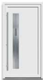
5778 S. 22