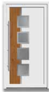
5787 S. 13