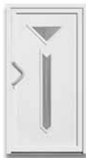
5305 S. 52