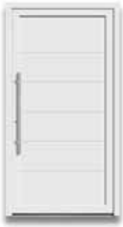
5877 S. 24