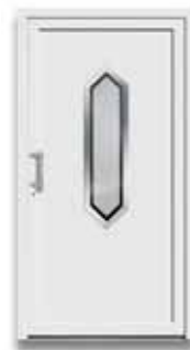
5022 S. 50