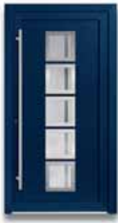
5505 S. 35