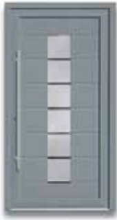
5868 S. 25