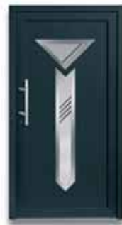
5105 S. 52-53