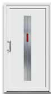
5777 S. 23