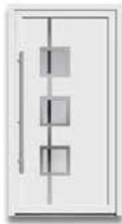
5889 S. 12