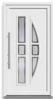
5880 S. 48