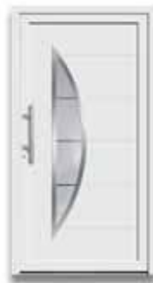
5878 S. 44-45