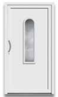
5008 S. 50