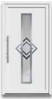
5870 S. 29