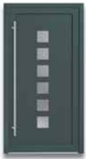
5872 S. 36