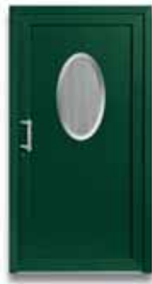
5031 S. 37