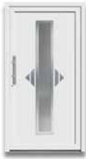
5657 S. 29