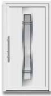
5891 S. 28