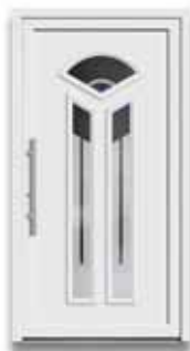
5434 S. 51