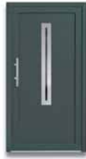
5772 S. 30