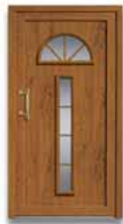
5049 S. 50