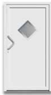
5023 S. 38