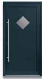
5723 S. 38