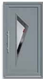
5112 S. 49