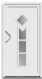
5885 S. 55