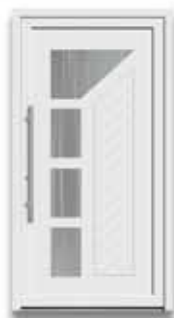
5549 S. 55