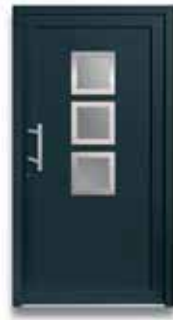
5503 S. 34