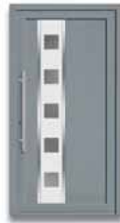
5784 S. 14