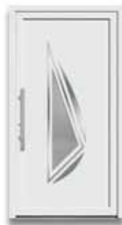
5884 S. 48