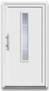
5172 S. 30