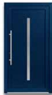
5865 S. 24