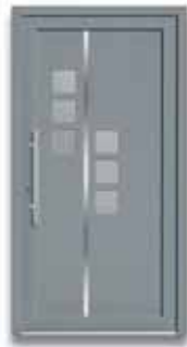
5783 S. 11