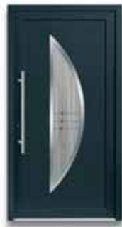
5114 S. 42-43