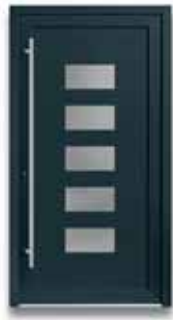
5873 S. 31