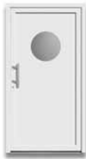
5756 S. 37