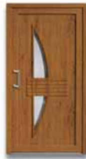
5857 S. 44-45