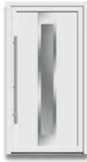
5866 S. 28