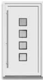
5704 S. 33