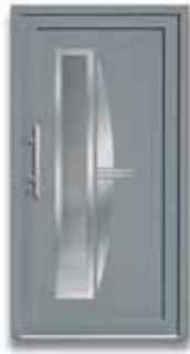
5656 S. 29