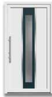
5863 S. 15