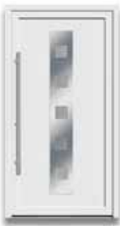
5875 S. 36