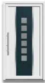
5782 S. 10-11