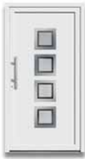
5504 S. 32-33