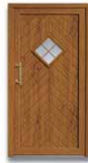
5323 S. 39