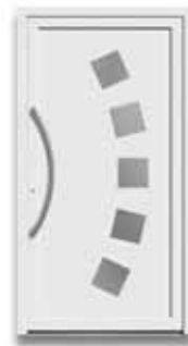
5881 S. 46