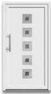
5705 S. 35