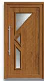
5335 S. 54-55