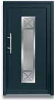
5286 S. 27