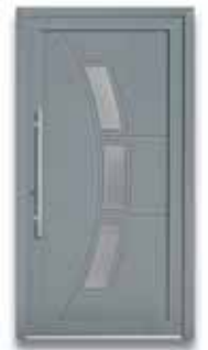
5883 S. 46-47