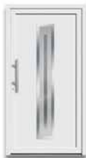
5177 S. 20-21