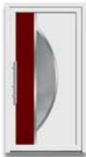
5864 S. 17