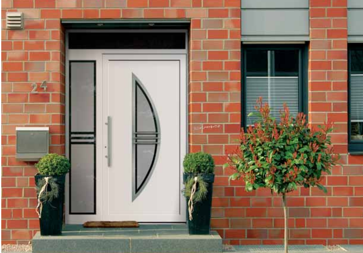
Modell 5890 | mit Ganzglas-Seitenteil | Rahmen – Edelstahloptik | mit Edelstahl-Zierbügel V 93 | Verglasung: G 1064 mattiertes Glas, Rand und Streifen klar | Griff: 9023-13 Edelstahl