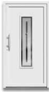
5115 S. 30