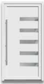
5874 S. 31