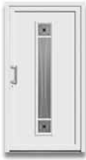
5186 S. 26