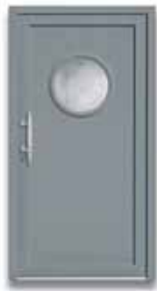
5156 S. 37